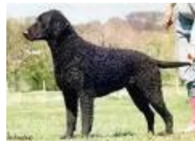
de Curlycoated Retriever