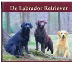
de Labrador Retriever

We kunnen de retrievers in de volgende rassen verdelen: