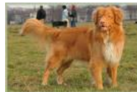
de Nova Scotia Duck Tolling Retriever

De Golden Retriever lijkt in alles veel op de Labrador, maar is over het algemeen iets gevoeliger.