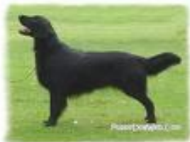
de Flatcoated Retriever