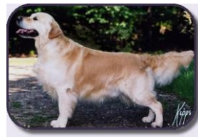
de Golden Retriever