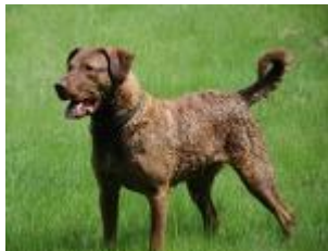
de Chesapeake Bay Retriever